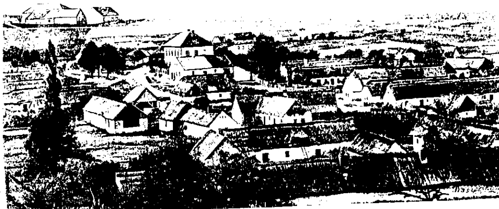
Vyžlovka v roce 1916