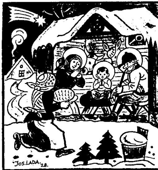
Jesličky. Namalováno v roce 1928. Kresba tuší a akvarel.

Oslavencům přejeme hodně zdraví a štěstí do dalších let.