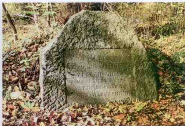
Lichtenštejnský památník v Louňovičkách a u Doubravčic.